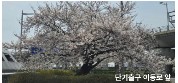
단기출구 이동로 앞