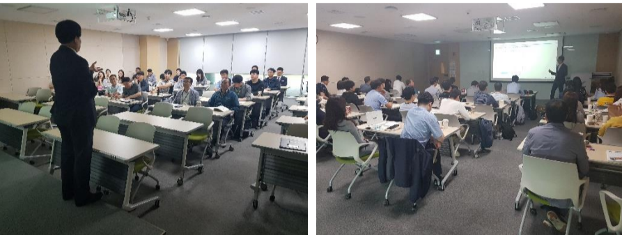
△ 2019 관리감독자 교육 현장