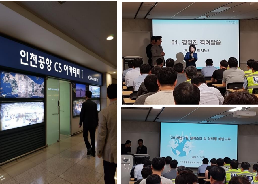
△ CS아카데미 교육 및 격려 말씀 현장

현장과 직접 소통을 중요시하는 경영진 분들의 뜻깊은 격려 말씀이 있었습니다. 앞으로 우리 회사가 소통의 문화를 바탕으로 더욱 더 발전할 수 있기를 기대합니다.