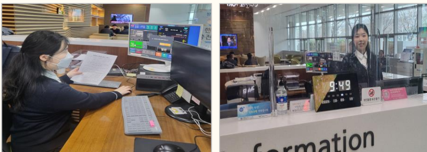
사내기자단 청사-인재개발원운영 피지현 파트장

현업에서 업무를 배우느라 하루하루 보냈더니 어느새 1년이 지나갔습니다. 좋으신 선배님들 덕분에 회사생활이 즐겁습니다. 월급이 올라가면 더 즐거울 것 같습니다. 열심히 하겠습니다.