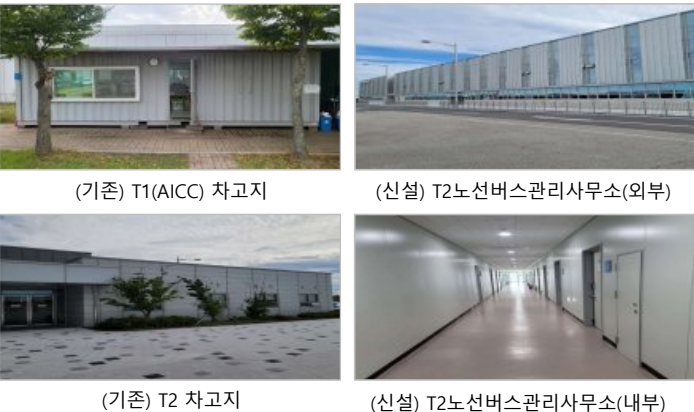
(기존) T1(AICC) 차고지

셔틀버스운영사업부의 차고지 통합이 되어 10월 16일 업무공간이 새롭게 개소될 예정입니다. AICC 근무자, T2에서 근무하는 셔틀버스운영사업부 근무자, 환경미화 직원들이 이용할 공간으로 이번 개선을 통해 낙후된 차고지를 쾌적하게 조성하여 직원들의 근무환경에 대한 만족도가 향상될 것으로 기대됩니다.