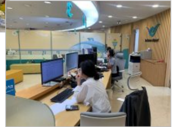
사내기자단 T1교통관리운영사업부 김성현