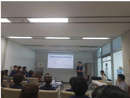
△ 탑승동 환경미화 교육 현장 (`19.7.19.)

우리 회사 인사팀에서 회사 체계 및 복리후생 제도 관련 교육을 진행하고 있습니다. 직원 여러분의 많은 관심 부탁드립니다.