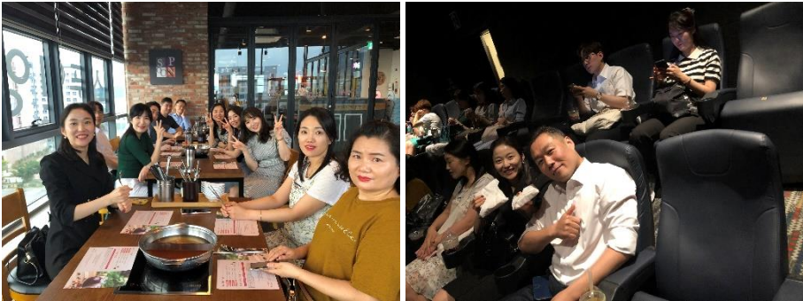
△ 귀빈실 운영 상생협력활동 현장 (`19.7.19.)

7월 19일 귀빈실 운영 상생협력활동 행사가 있었습니다. 영종 메가박스에서 영화를 관람한 후 스폰인영종에서 석식 식사 시간을 가지며 직원들간 화합하고 소통할 수 있는 의미 있는 시간을 가졌습니다.