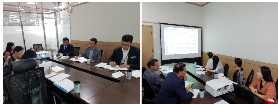
△ 120다산 콜재단 방문 현장 (`19.7.19.)

7월 19일 여객터미널 헬프데스크 타기관 벤치마킹 위한 자리를 마련 하였습니다. 우리 회사 경영기획 실장, 터미널운영팀 팀장, 여객터미널 운영 과장 외 3명으로 총 6명의 경영진 및 직원분들이 서울시 ‘120다산 콜재단’에 방문했습니다.