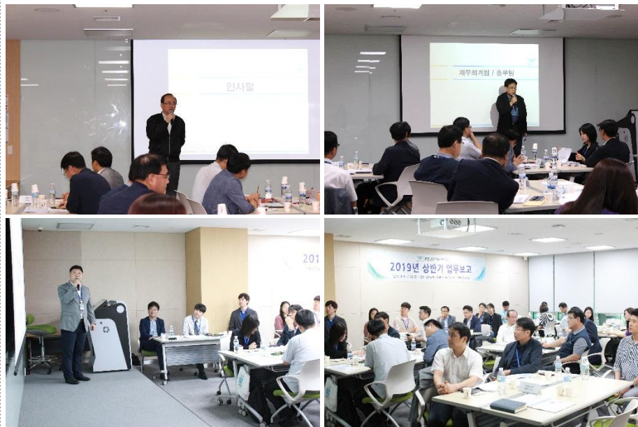
△ 2019년 상반기 업무보고회 현장 (19.7.26.)