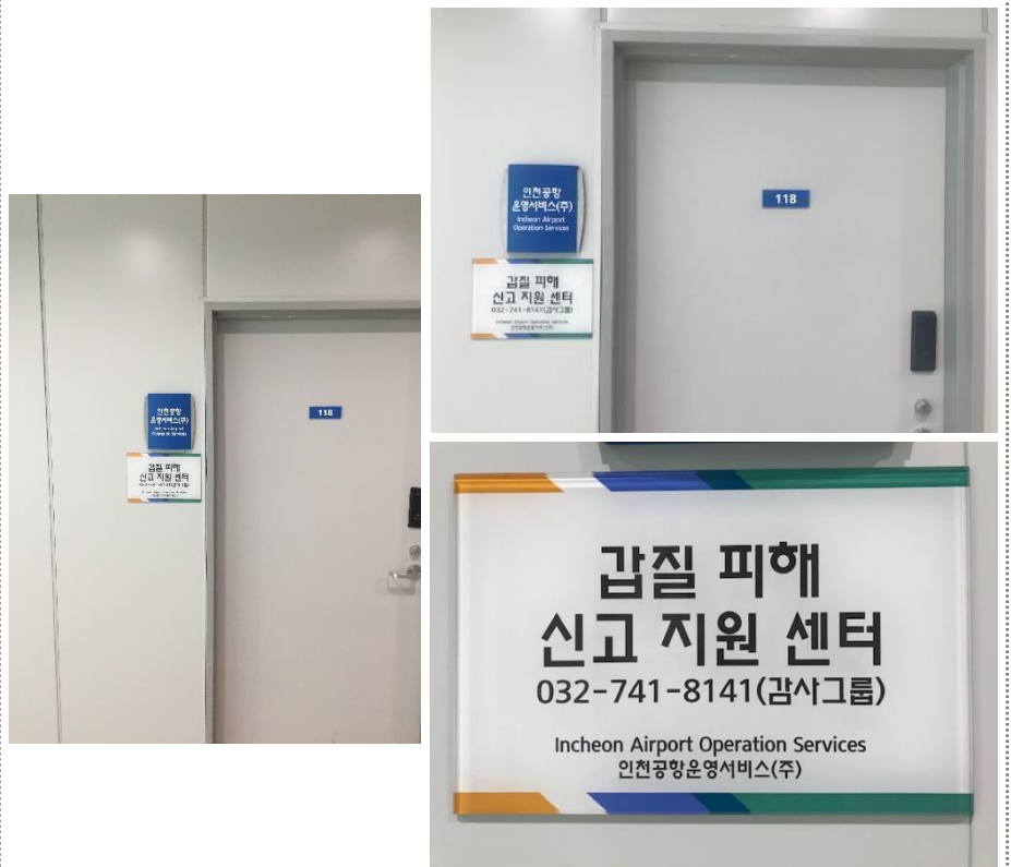
△ 갑질 피해 신고 지원 센터