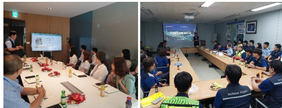
△ 자료관리 교육 현장 (`19.8.2.) △ 자유무역지역 교육 현장 (`19.8.6.)