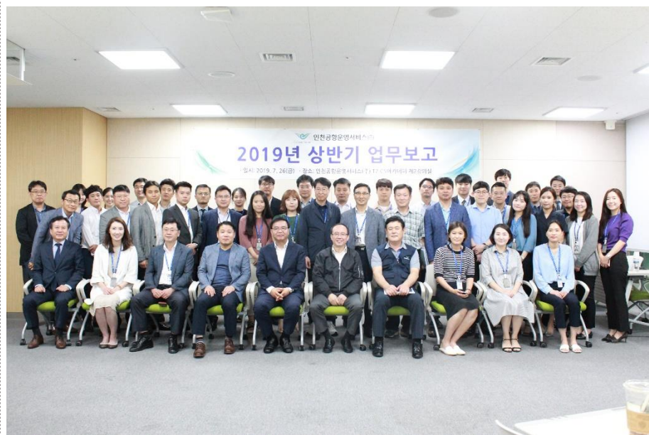
△ 2019년 상반기 업무보고회 기념사진 (19.7.26.)

7월 26일 제2여객터미널 CS아카데미 II 제3강의실에서 우리 회사 `19년도 상반기 업무보고회가 있었습니다. 이번 보고회는 우리회사 `19년도 상반기 업무실적 및 하반기 업무계획 보고와 현안 공유를 위해 시행되었으며 지원부서와 10개 사업소별 업무실적 및 계획보고로 이루어졌습니다. 보고회는 13:20부터 17:30까지 4시간 가량 진행되었으며 행사 종료 후 석찬 자리를 마련했습니다. 상반기 업무보고회를 성공리에 마칠 수 있도록 도움을 주신 지원부서 27명, 사업소장 및 행정팀장 20명 총 47명의 참석자분들을 비롯해 `19년도 상반기동안 우리 회사를 위해 힘써주신 전 임직원 여러분께 진심 어린 감사의 말씀을 전합니다.