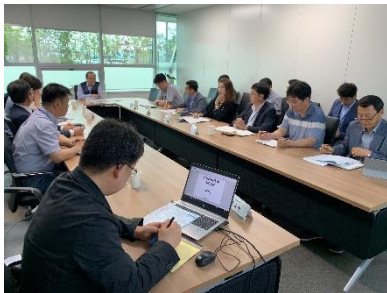
△ 터미널사업부문 주간회의 (`19.8.1.)

`19년 8월부터 사업소 주간회의를 '터미널사업부문'과 '운송사업부문'으로 구분하여 진행합니다. 8월 1일 터미널사업부문 주간회의 1회차가 진행되었습니다.