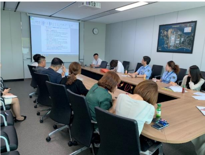
△ 비전자 기록물 전자문서시스템 등록 교육 현장 (`19.7.17.)

우리 회사 문서 관리에 많은 신경을 써 주신 자료관리 운영 사업소장님께 감사의 인사를 전합니다.