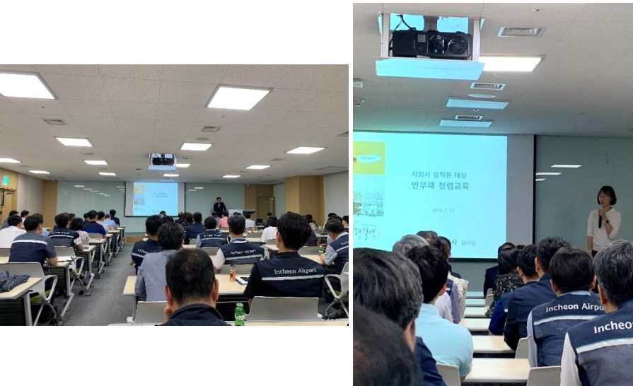
△ 찾아가는 청렴교육 현장 (`19.7.17.)

7월 17일 제2여객터미널 CS아카데미 제1강의실에서 공사 감사실 주관 ‘찾아가는 청렴교육’이 있었습니다. 공사 상임감사위원 및 감사실 담당자가 교육을 진행하였으며 청탁금지법, 윤리규정(임직원 행동강령) 등 반부패 청렴 관련 내용이 다뤄졌습니다. 이번 교육은 지원부서 26명, 사업소 52명 총 78명의 관리자를 대상으로 우선 진행된 교육으로 현재 10개 사업소별 직원들을 대상으로 한 전파교육을 진행 중입니다.