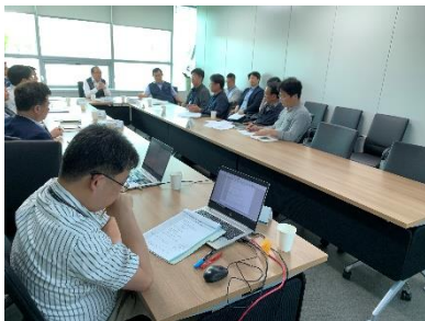
△ 운송사업부문 주간회의 (`19.8.8.)

8월 8일에 운송사업부문 주간회의 1회차가 진행되었습니다. 본사 추진사항, 사업소 협조 및 요청사항, 사업소별 주간업무보고, 주요 현안 논의 등을 통해 전사 커뮤니케이션 체계가 더욱 활성화 될 수 있기를 기대합니다.