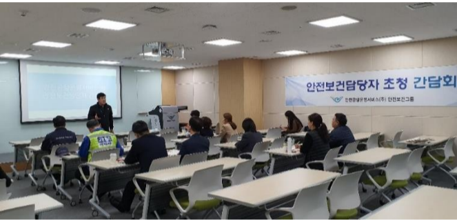
△ 안전보건담당자 간담회 (`19.11.5.)

11월 5일 안전보건간담회가 시행되었습니다. 우리회사 안전·보건 관리 계획의 수립·시행 등에 필요한 사항에 대하여 실무담당자 간 소통을 위해 마련한 자리로 안전보건그룹, 사업소별 안전보건담당자, 직무대행자 분들께서 참석해 주셨습니다. 이번 간담회에서는 분기별 합동점검 결과 공유 및 향후 방향 논의, 안전보건그룹 분기점검결과 공유, 공항공사 워크숍 결과 공유, 기타 안전보건 관련 사항 논의, 추후 안전보건간담회 주제 등에 대한 논의가 이루어졌습니다.