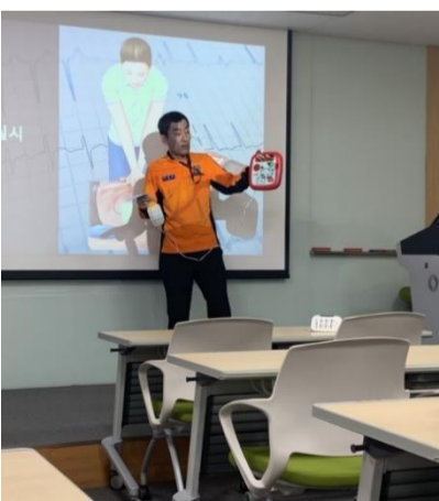
△ 소방안전교육 현장('19.10.23.)

10월 23일 공항소방대 예방안전실 주관 인천공항 종사자 대상 법정 소방안전교육에 참석하였습니다. 우리회사를 포함한 8개 협력사를 대상으로 한 이번 교육은 10월 21일, 23일 양일간 진행되었습니다. 우리회사 본사 및 사업소 직원들이 교육에 참석하여 화재신고 및 피난, 피난유도 등 화재초기대응에 관한 사항과 일상생활 속 응급처치(심폐소생술, 자동제세동기사용법) 교육을 수강하였습니다.