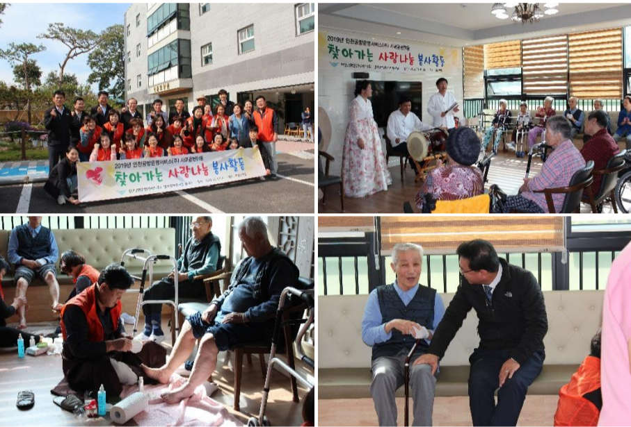
△ 봉사활동 현장(`19.10.16.)

10월 16일 우리회사 사회공헌활동을 시행하였습니다. 나눔문화 확산 및 사회적 배려대상 지원을 통해 공기업 자회사로서 사회적 책임을 실천하기 위하여 마련한 행사로 우리회사 임직원 10명 및 ‘발사랑 이웃사랑 봉사단’ 20명이 참여하였습니다. 인천시 중구 운남동에 위치한 영종요양원에 방문해 어르신들에게 발마사지, 네일아트, 국악공연 등을 제공하며 찾아가는 사랑나눔 봉사활동을 진행했습니다.