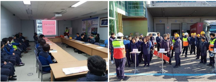
△ 하반기 소방종합훈련 현장('19.11.7.)

11월 7일 자유무역지역 운영 사업소에서 화물터미널C 하반기 소방종합훈련을 시행하였습니다. 자위소방대 소집 및 임무부여, 대피 및 유도, 진압반·구조구급반 투입 등이 진행되었습니다.