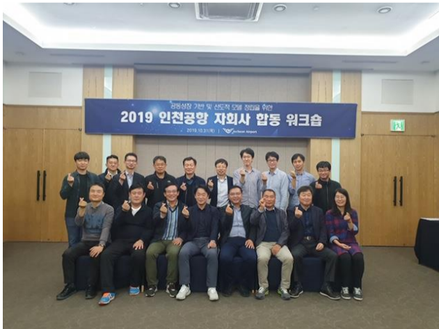
△ 합동 워크숍 현장(`19.10.31.~11.1.)

10월 31일에서 11월 1일까지 제주도에서 진행된 인천공항 자회사 합동 워크숍에 참석하였습니다. 1박 2일 일정으로 우리회사 경영기획실장님, 관리지원실장님, 경영기획그룹장님 외 실무자 2명과 공사, 1자회사 임직원 총 19명이 참석하여 2020년 정규직 최종 전환 대비를 위한 모.자회사간 공감의 장을 마련하였습니다. 정부 정규직 전환 추진 내용과 자회사 정책 방향을 논의하였고, 자회사 주요 현안 발표와 토의 등이 이루어졌습니다.