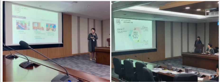
△ 윤리경영추진단 워크숍 현장(`19.10.29.)

10월 29일 윤리경영추진단 워크숍이 시행되었습니다. 윤리경영 네트워크를 재정비하고 윤리경영 추진 실행력을 강화하여 공항가족이 소통하는 윤리경영 문화 확산을 위해 마련된 행사로 연1회 진행됩니다. 자회사별 윤리담당자, 자회사 및 협력사 용역별 윤리파트너위원이 참여한 이번 워크숍에서는 기관별 윤리경영 추진현황 공유와 공동사업 의견 공유 및 아이디어 논의가 이루어졌습니다. 워크숍을 통해 공사와 자회사간 윤리경영 네트워크를 공고히 하고, 윤리경영 문화 확산을 위한 실천방법을 논의하는 시간을 가졌습니다.