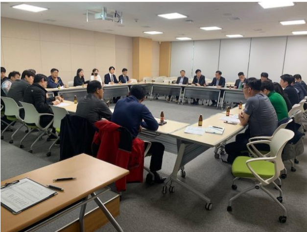
△ 팀장간담회 현장(`19.10.23.)

10월 23일 팀장간담회를 시행하였습니다. 관리자간 소통과 화합을 위한 정례회의로 본사 그룹장, 팀장 및 사업소 팀장 26명이 참석하였습니다. 본사의 진행사항과 사업소에 대한 요청 및 협조사항을 전달 하고, 사업소의 요청 및 건의사항을 청취하는 시간을 가졌습니다. 또한 이번 간담회에서는 전직원 상호 교류 및 화합 방안에 대해 논의하였으며 추후 논의된 의견을 긍정적으로 검토하여 전직원 상호 교류 및 화합을 위한 프로그램을 마련할 계획입니다.