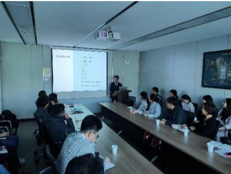
△ 세무교육 현장('19.10.11.)

10월 11일 세무교육을 시행하였습니다. '실무에 적용되는 기초세무회계 교육'과 '재무업무 유의사항 안내'가 진행되었으며 본사, 사업소 실무자들이 참석하였습니다. 기초세무회계 교육은 TS세무회계컨설팅에서 진행하였으며 적격 증빙의 이해, 계정과목의 이해, 업무용 승용차에 대한 세무실무, 부가세 매입세액 불공제 사항 등으로 이루어졌습니다. 이어서 우리회사 재무회계팀 과장님께서 증빙 관리와 ERP 전표 입력에 관한 재무업무 유의사항 안내를 진행하며 실무자들에게 필요한 지식과 업무능력을 제고하는 시간을 가졌습니다. 이번 교육이 우리회사의 투명하고 전문성 있는 회계 운영에 도움이 되길 바랍니다.