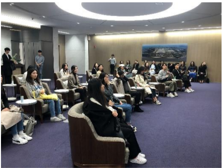
△ 호서대학교 견학 현장('19.10.22.)

10월 22일 귀빈실 운영 사업소에서 호서대학교 항공서비스학과 학생들을 대상으로 한 견학을 진행하였습니다. 40여명의 호서대학교 학생들이 참석하였으며 의전업무 소개와 귀빈실 및 홍보전망대 견학이 진행되었으며 채용, 업무, 회사 등에 관한 학생들의 궁금증을 해소하는 질의응답 시간을 가졌습니다.