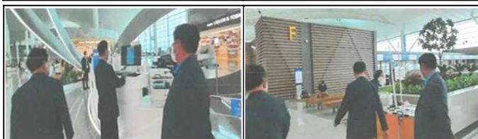
T2여객터널 안내데스크 점검