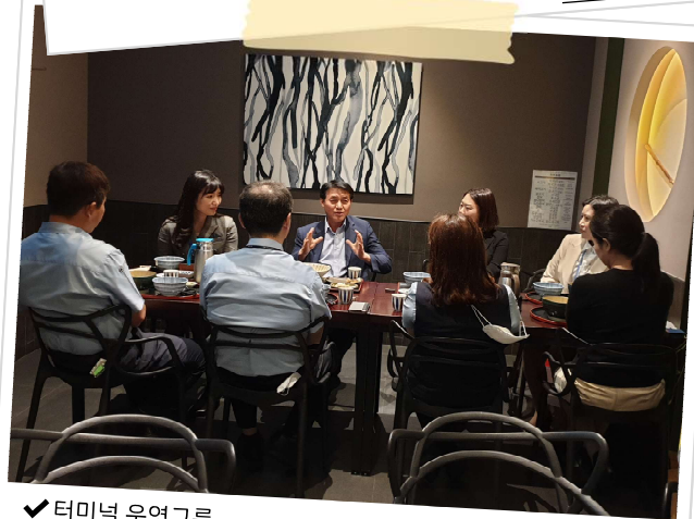
✓ 터미널 운영그룹