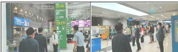
탑승동 안내데스크 점검