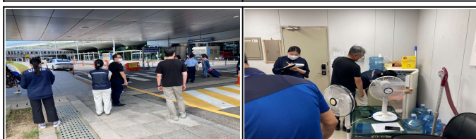
교통, 셔틀, 환경미화, FTZ 옥외근로자 탄력근무제 및 보호조치