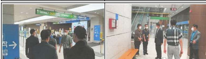
탑승동 입국절차 방역상태 점검