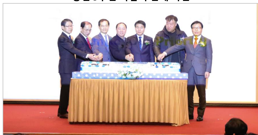
&lt; 케익 커팅식 &gt;