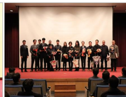
&lt; 모범직원 포상 &gt;

1.19. 회사 창립 5주년을 맞이하여, 창립기념식이 개최되었습니다. 창립기념식에는 경영진, 임직원 및 노동조합 대표 등 약 100여명이 자리를 빛내주셨습니다. 이번 행사는 우리회사의 경과 보고, 기념사 및 축사, 시상식 순으로 진행되었으며, 창립 5주년을 기념한 우리회사의 주요 사업 및 성과에 대한 영상을 시청하는 자리를 가졌습니다. 또한, 시상식은 '23년 우수부서 포상과 모범직원상, 공로, 격려상을 시상하여 한 해 동안 노력한 직원들에게 감사의 뜻을 전하였습니다. 회사의 창립 5주년을 다시 한번 축하하며, 직원 여러분들의 노고에도 깊은 감사의 말씀을 전합니다.