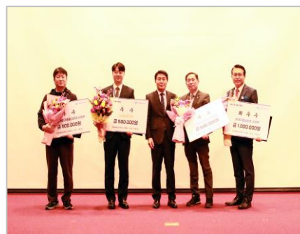
&lt; '23년 우수부서 포상 &gt;