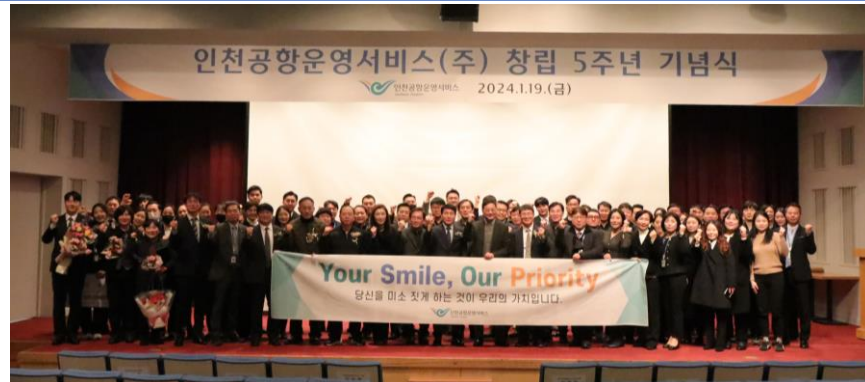
&lt; 창립 5주년 기념식 단체 사진 &gt;