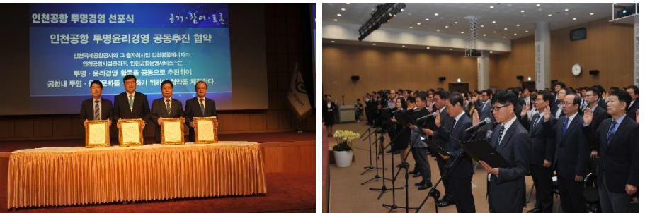
△ 투명경영 선포식 (`19.10.1.)

10월 1일 ‘인천공항 투명경영 선포식’이 개최되었습니다. 인천공항 투명경영의 3대 원칙(공개-참여-토론)을 공유·실천하기 위한 행사로 공사 임직원 400여 명 및 우리 회사 사장님을 포함한 자회사 대표님들께서 참석하셨습니다. 행사는 투명경영 추진계획 발표, 투명경영 선언, 투명윤리경영 업무협약으로 이루어졌습니다.