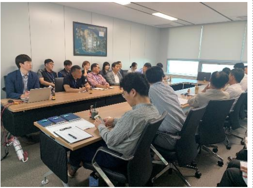
9월 팀장간담회 (`19.9.18.) ▷

9월 18일 팀장간담회가 시행되었습니다. 팀장간담회는 사업소 핵심 이슈 공유와 애로사항 협의를 위하여 월1회 진행됩니다. 지원부서 및 10개 사업소 팀장 등 관리자들께서 참여해 주셨으며 지원부서, 사업소 논의사항과 질의응답으로 진행되었습니다. 이번 팀장간담회를 통해 관리자 간의 자유로운 소통과 현장 의견의 청취가 이루어졌습니다. 10월 팀장간담회는 10월 23일 시행될 예정입니다.