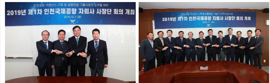
△ 사장단 회의 (`19.10.1.)

10월 1일 1차 사장단 회의가 개최되었습니다. 사장단 회의는 공항공사와 우리 회사, 인천공항시설관리(주), 인천공항에너지(주)가 참석하는 회의로 격월로 1회 진행됩니다. 자회사 운영 실적 및 계획, 경영 현안 및 이슈사항 등을 논의하는 자리로 이번 회의는 자회사 별 설립 연혁, 주요 실적 및 중점 추진사항과 공항공사 주요사항 공유 등으로 진행되었습니다. 사장단 회의를 통해 공사와 자회사 간 현안과 계획을 공유하고, 소통하는 기회를 가졌습니다. 이날 회의에서 안정적인 정규직 전환 방안, 자회사 직원 처우 개선, 자회사 전문성 함양 등에 대해 심도 있는 논의를 진행했습니다.