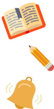
◁투명·윤리 골든벨 (`19.9.18.)