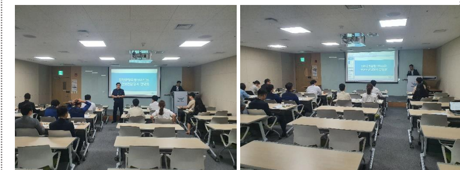
△ 안전보건담당자 간담회 (‘19.9.18.)

9월 18일 안전보건담당자 간담회가 개최되었습니다. 우리 회사 안전·보건 관리 계획의 수립·시행 등에 대한 실무담당자 간 소통의 자리로 안전보건그룹, 사업소별 안전보건담당자, 직무대행자 분들께서 참석해 주셨습니다. 간담회는 간담회 정의 및 운영 방안 설명, 건강 검진 관련 전체적인 진행 상황 설명, 본사 추진계획서 설명, 안전·보건 담당자와 고충 및 관련 업무 토론으로 이루어졌습니다. 안전보건담당자 간담회를 통해 우리 회사 안전·보건 조직이 더욱 발전하기를 기대하겠습니다.