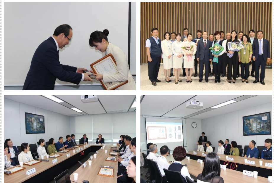
△ 포상 수여식 (‘19.10.2.)

10월 2일 ‘2019년 하계 및 추석 성수기 직원 포상 수여식’을 개최하였습니다. 이번 수여식은 회사 출범 이후 처음으로 시행한 전사 차원의 포상으로 업무 현장에서 최선을 다한 직원들의 사기 진작과 자긍심 고취를 목적으로 시행하였습니다. 포상 수여자 12명 및 본사 임직원 등 총 20여명이 참석한 가운데 뜻 깊은 시간을 가졌습니다.