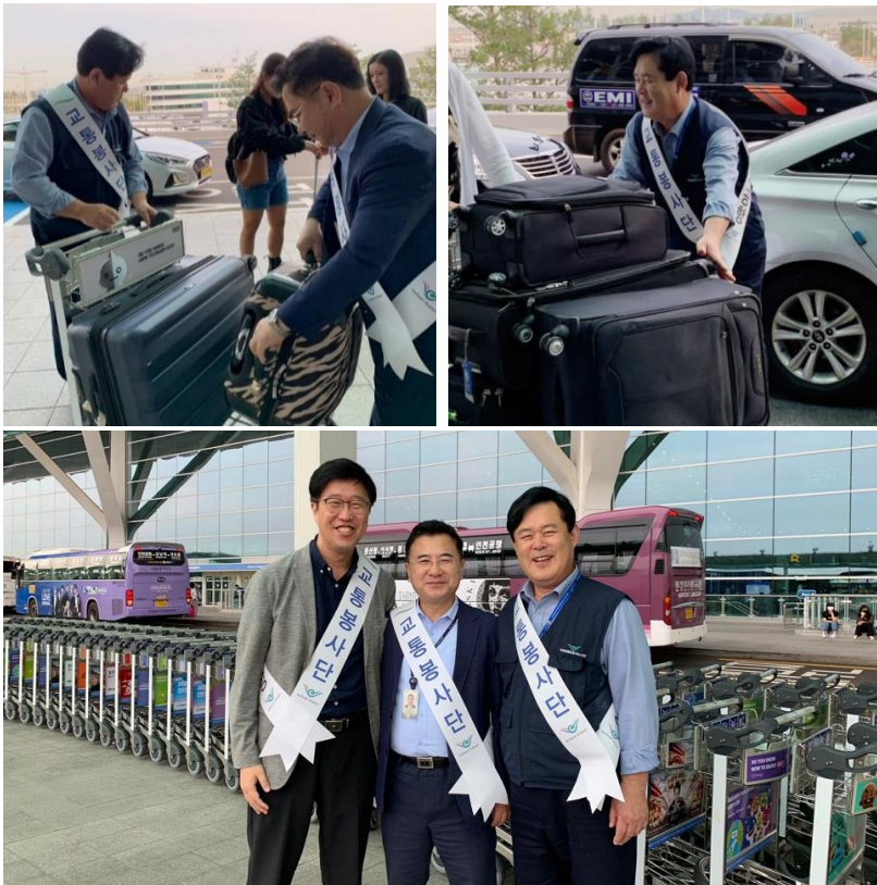
△ 교통안전 합동캠페인 (‘19.9.27.)

9월 27일 교통안전 합동캠페인을 실시했습니다. 인천공항 교통안전 문화 확산을 위하여 제2여객터미널 입·출국장 및 커브사이드 횡단보도, 승차장에서 실시하였으며 우리 회사 관리지원실장님, 감사그룹장님, 교통운영팀장님께서 참여해 주셨습니다.