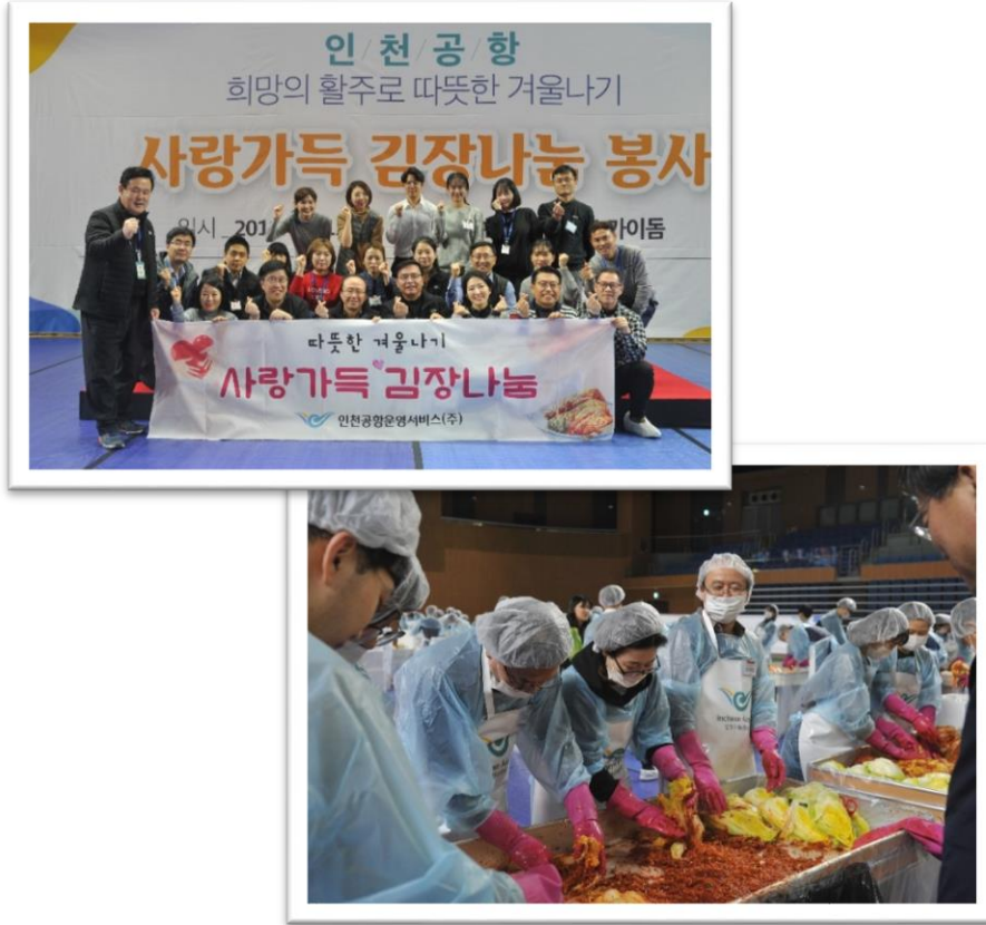
△ ‘사랑가득 김장나눔’ 봉사활동 (‘19.12.12.)

2019년 12월 12일 공항공사 사회공헌팀에서 주최한 ‘인천공항 따뜻한 겨울나기 사랑가득 김장나눔’ 봉사활동에 우리회사 사장님, 경영 기획실장님, 관리지원실장님과 직원들이 참여하였습니다. 이날 다 함께 힘을 합쳐 담근 김장김치 1만 7,000kg은 기초생활수급자를 비롯하여 차상위 계층, 독거노인, 장애인, 한부모가정 등 소외계층 1,200 가정과 공항 인근 복지시설 4개소에 전달되었습니다. 뜻깊은 행사에 자발적으로 참석하여 사회 곳곳에 따뜻한 손길을 전해 주신 우리회사 임직원분들께 진심으로 감사의 말씀을 전합니다.