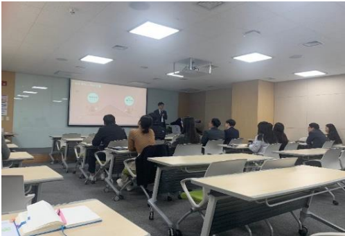
△ 퇴직연금 가입자 교육 현장(‘19.12.18.)

2019년 12월 18일 본사 직원을 대상으로 퇴직연금 가입자 교육이 진행되었습니다. 직원분들의 퇴직연금 제도에 대한 이해를 높이고, 퇴직연금과 관련된 유용한 정보를 얻을 수 있는 시간을 가졌습니다.