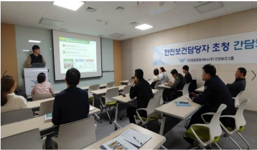
△ 안전보건담당자 간담회 현장(19.12.19.)

2020년 1월 16일부터 시행될 개정된 산업안전보건법의 주요 내용으로는 법의 보호대상 확대, 원청의 책임범위 및 처벌수준 강화, 사업주의 처벌수준 강화 등이 있습니다. 자세한 내용은 각 사업소에 배포되는 산업안전보건법 관련 포스터 2부와 고용노동부, 안전보건공단 산업안전보건법 개정 주요내용을 참고하시길 바랍니다.