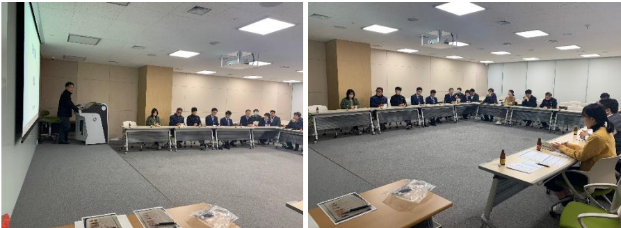
△ 12월 팀장간담회 현장(`19.12.18.)

2019년 12월 18일 5회차 팀장간담회가 진행되었으며 본사 그룹장, 팀장 및 사업소 팀장 총 22명이 참석해주셨습니다. 이번 간담회에서는 12월 본사 추진사항 전달 및 공유가 이루어졌고 회사 발전 및 업무 간소화를 위한 제언·아이디어 논의가 진행되었습니다. SNS 교류의 장 마련, 장기근속자 및 우수사원의 국내외 연수제도 재도입 등의 여러가지 의견이 논의되었고 본사 차원의 법정 필수교육 효율화 등에 대하여 자유로운 분위기 속에서 이야기를 나누었습니다.