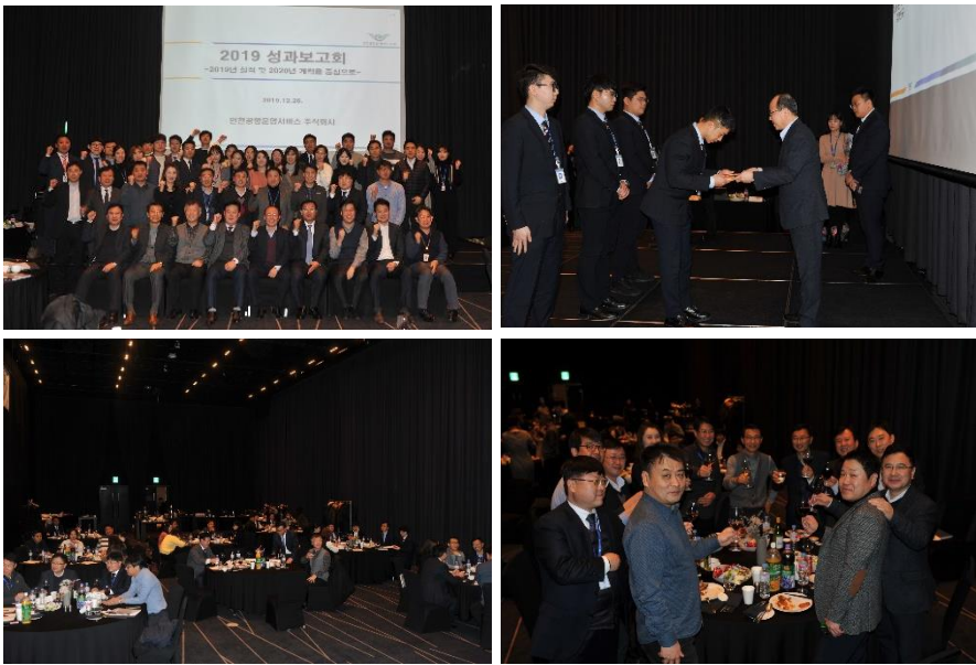
△ 2019 성과보고회 (`19.12.26.)

우리회사 임직원 여러분들의 일 년간 노고에 큰 감사의 말씀을 전하며 2020년 경자년에는 다 함께 더욱 더 밝은 미래를 그려나갈 수 있기를 기대합니다. 성과보고회 자리를 빛내주신 모든 분들께 감사의 말씀을 전하며 경자년 새해복 많이 받으시길 바랍니다.