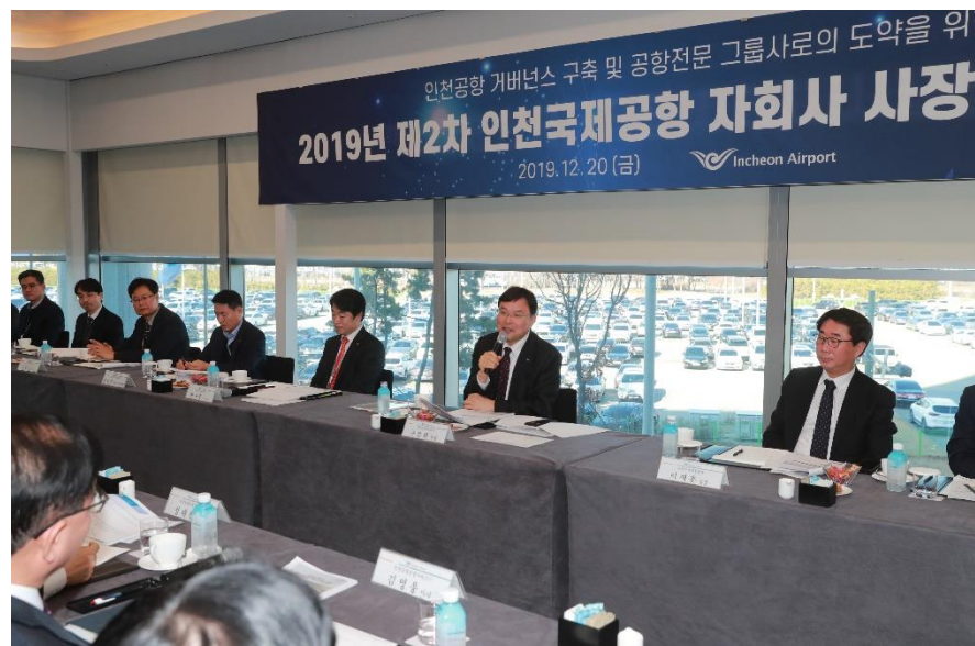
△ 제2차 사장단 회의(`19.12.20.)