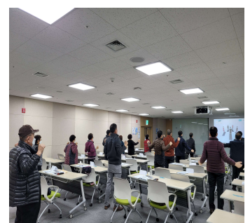
&lt;일상생활 속 건강관리 방법&gt;