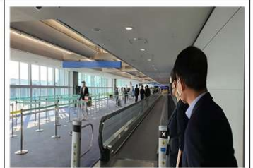
점검내용 : 입국 승객 방역절차 점검