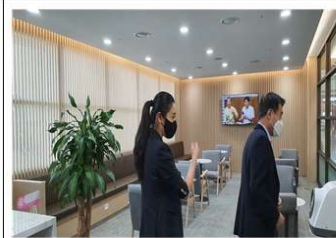
점검내용 : 입국장 교통약자 서비스센터 점검(2)