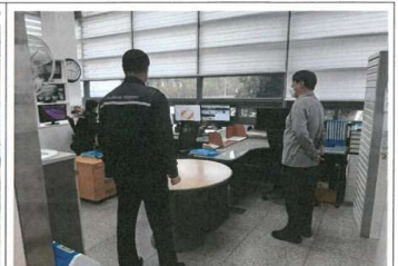
점검내용 : 공항물류단지 종합상황실 근무자 격려