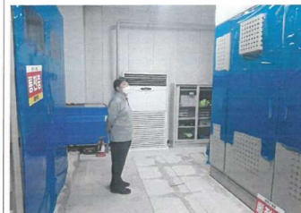
점검내용 : 화물터미널"C" 전기실 개선공사 현장 확인