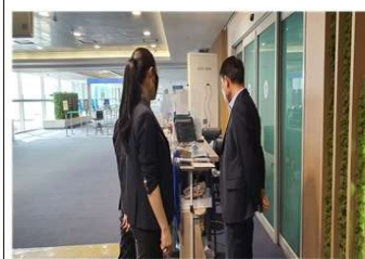
점검내용 : 입국장 방역절차 점검