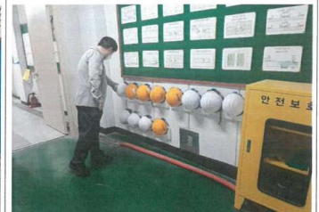
점검내용 : 보호구 이상유무 확인