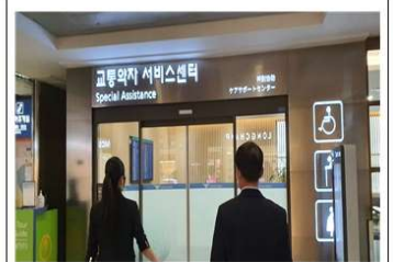
점검내용 : 입국장 교통약자 서비스센터 점검(1)