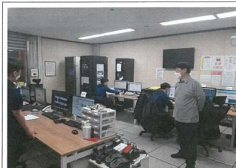
점검내용 : 화물터미널"C" 중앙감시실 근무자 격려